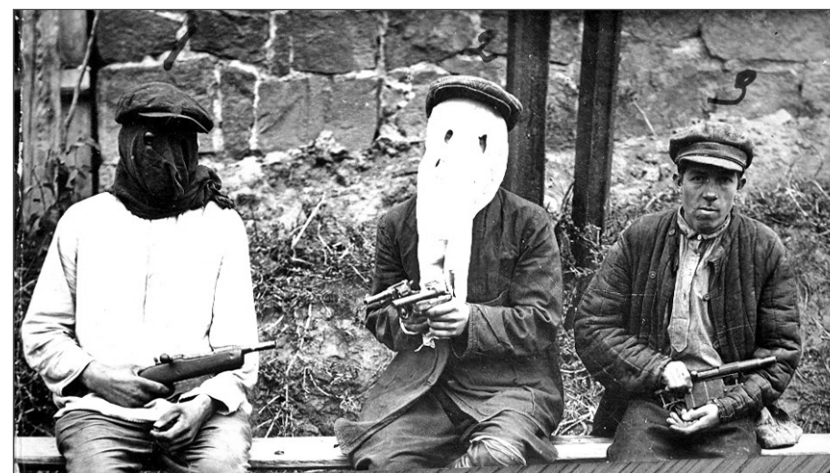
Члени кримінального угруповання із зброєю і у масках. Вересень 1932 р. ГДА МВС, м. Вінниця, спр. 5925.