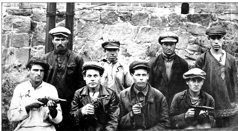
Загальне фото членів кримінального угруповання. Вересень 1932 р.

лян навколишніх сіл. Перелік викраденого засвідчує злиденність населення. Головним у переліку награбованого були продукти: декілька пудів картоплі та збіжжя, кілька кілограмів різної крупи та шматків сала, горщик топленого масла, хліб, молочні продукти.